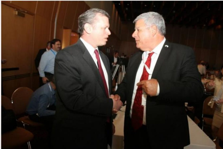
ראש העיר עם מנכ"ל משרד ראש הממשלה