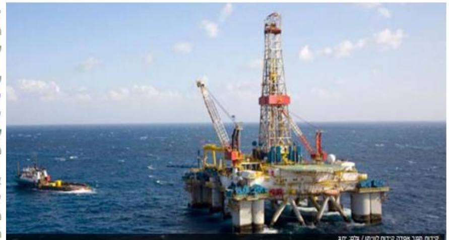
קידוח תמר אסדה קידוח לויתן / גלובס

אנרגיה | גז טבעי | קידוח לויתן | טשאים למעקב <<