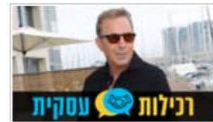
קווין קוסטנר בהרצליה

צבע טרי ל-VIP, רקנאטי משמר את תרבות סלוניקי, רסין פותח מוזיאון למשקפיים, האופרה פוגשת את באן קי מון ויוסי אבו מהדמ את שותפות לווינת