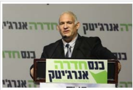
ישראל דנציגר, מנכ"ל המשרד להגנת הסביבה, דובר בקונגרס אנרגיטק.

ישראל דנציגר, מנכ"ל המשרד להגנת הסביבה, קרא להצמיד את השימוש באנרגיה לא מזהמת קדימה: "בקרב נחוג את פסח שמסמל מעבר לחירות. לצערי בתחום האנרגיה אנו רחוקים מאוד ממצב של חירות. בכל שנה מתים בטרם עת 2,500 אנשים מזהום. יותר מתאונות, יותר מפיגועים ויותר ממבצעים צבאיים. זה קשור הרבה לשימוש באנרגיה בישראל – שריפת פחם, פעילות התעשייה, שימוש בדלקים מזהמים בתחבורה ועוד. רכב שמונע בגז מזהם ב-80% פחות אך השימוש ברכבים כאלה בישראל עומד על פחות מ-1.5%. בעולם כבר קובעים תקנים ויעדים של עשרות אחוזים בניין זה. יותר מ-50% מייצור החשמל שלנו ב-2014 היה מפחם בעוד במדינות אחרות ב-OECD יש קישון משמעותי בתחום זה. שלא יספרו לי על ביטחון אנרגטי. אין דבר בטוח יותר מרשת חשמל מבזרת מאשר ריכוזת".